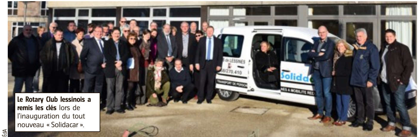
Le Rotary Club lessinois a remis les clés lors de l'inauguration du tout nouveau « Solidacar ».

La mise en route du projet est le fruit d'une collaboration active entre plusieurs acteurs locaux. En effet, le Rotary club de Lessines a travaillé avec les CPAS de Lessines et Ellezelles, ACIS, Dieteren et AVIP, ainsi que la participation du Tournoi International de Tennis en fauteuil roulant et la Foundation Rotary.