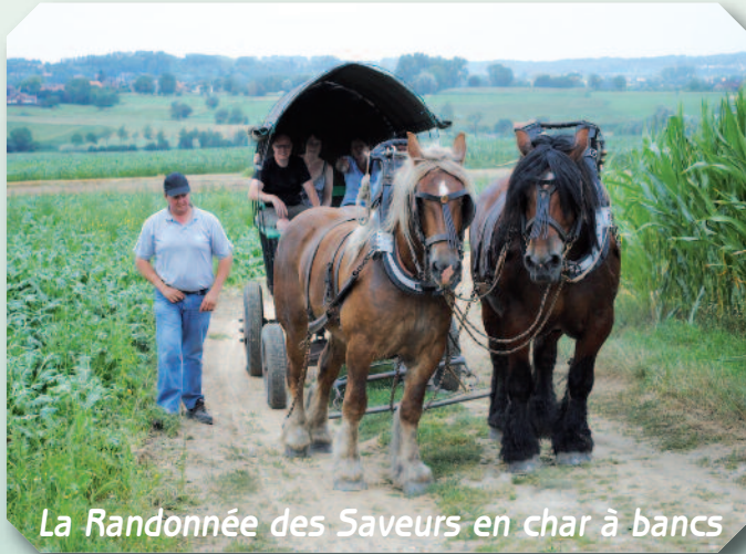
La Randonnée des Saveurs en char à bancs

U kunt deze ontdekkingsstocht maken met een authentieke huifkar. Samen met de rustige stap van de trekpaarden en de sfeervolle animatie van de gids zult u de pracht van deze mooie streek ontdekken.