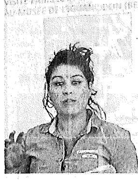
La chargée de mission s'occupe du développement touristique des filières famille et scolaires.