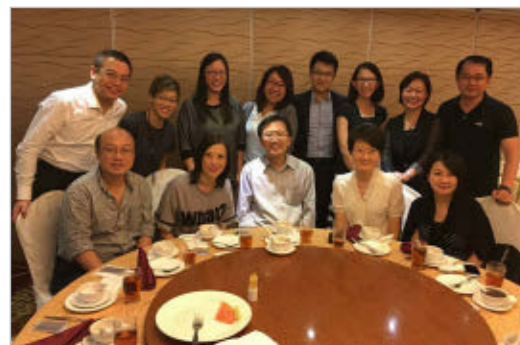
Des anciens représentants Rotaract de district dînent ensemble durant la Semaine Reconnect 2015.

Lorsque vous planifiez votre événement, publiez des informations sur votre site Web. Vous pouvez aussi utiliser le groupe de discussion des Anciens sur Mon Rotary et les réseaux sociaux. Utilisez également le rapport Anciens pour travailler avec les