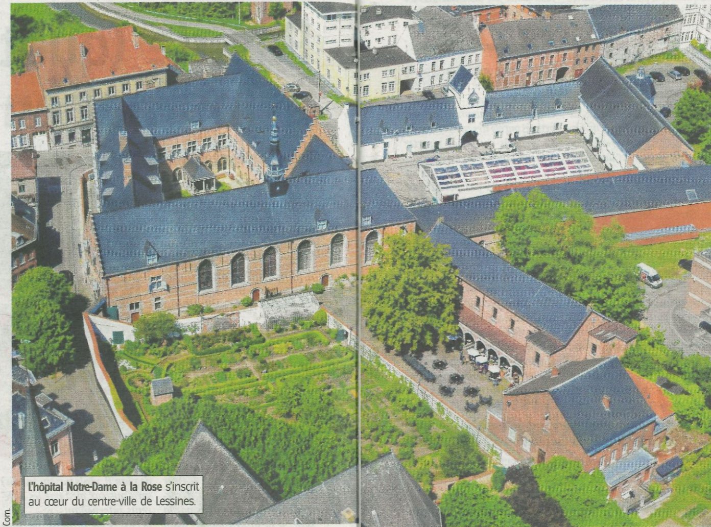
L'hôpital Notre-Dame à la Rose s'inscrit au cœur du centre-ville de Lessines.

produits locaux qui y sont proposés. Un lieu idéal à tester en famille ou entre amis. En attendant votre repas ou votre glace, n'hésitez pas à aller jeter un œil au jardin des plantes médicinales ou au potager qui jouxtent la terrasse et sont accessibles librement. De quoi s'imprégner au mieux de ce lieu authentique chargé d'histoire, en toute simplicité.