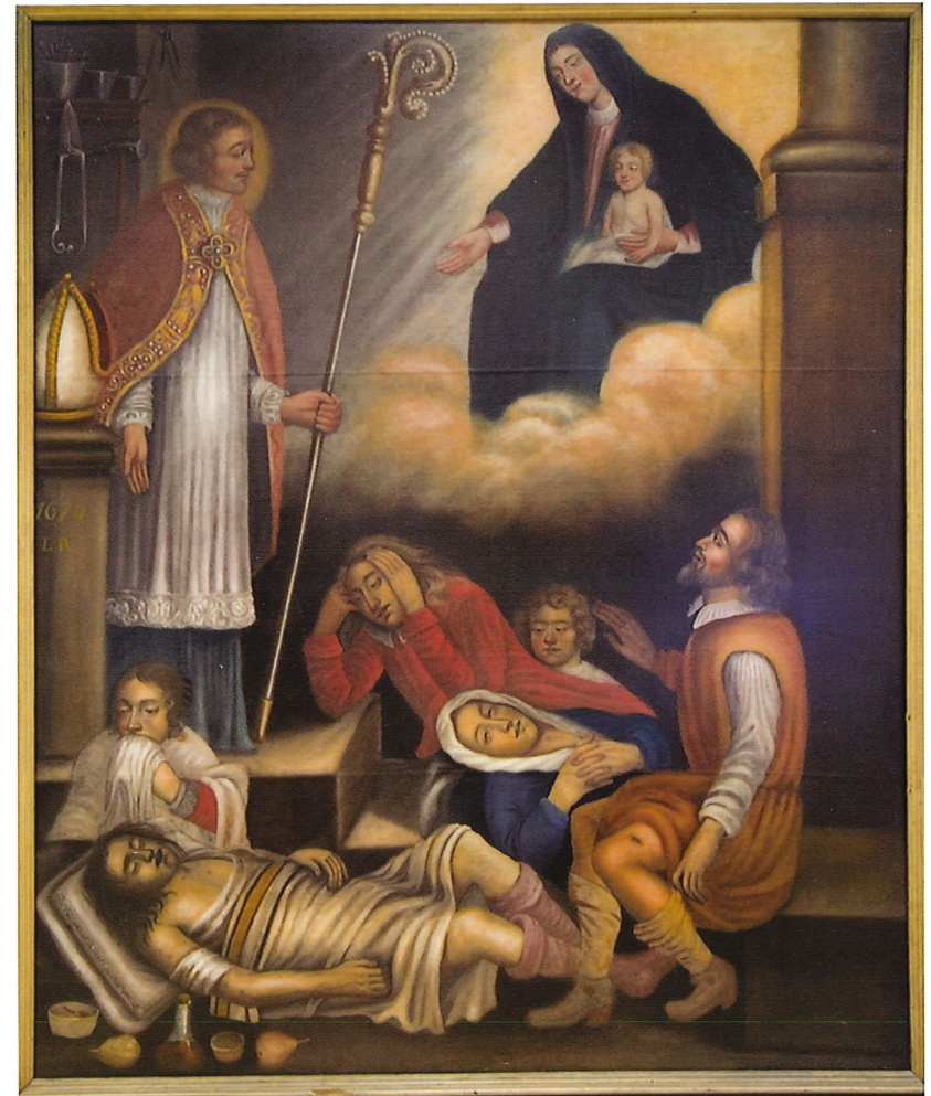
Saint Eloi guérissant des malades de la peste, Hôpital Notre-Dame à la Rose