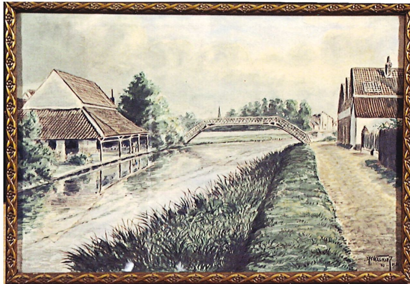
Paul Wagniez, Lavoir Hublart à Ath, collection privée

À partir de janvier 2023, l'ouvrage sera vendu 60 €.